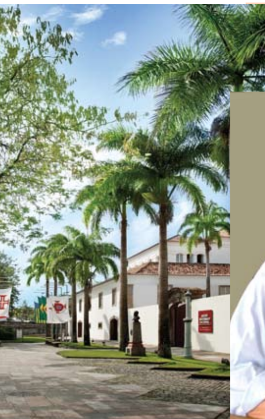
Fachada principal (detalhe)