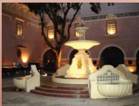
Pátio dos Canhões.