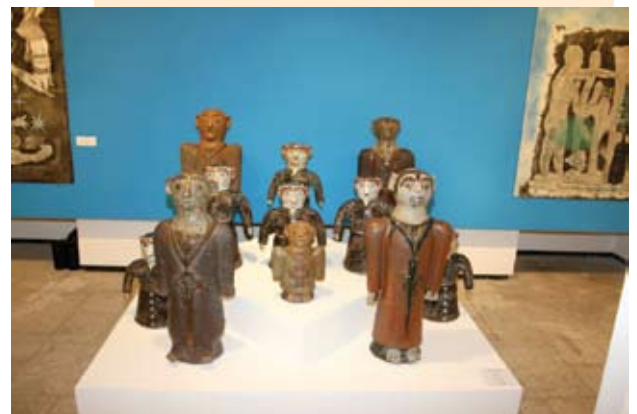
Exposição “Elos da Lusofonia”