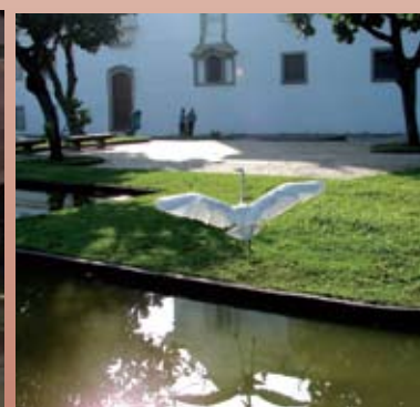
Praça João Paulo II, anexa ao MHN.