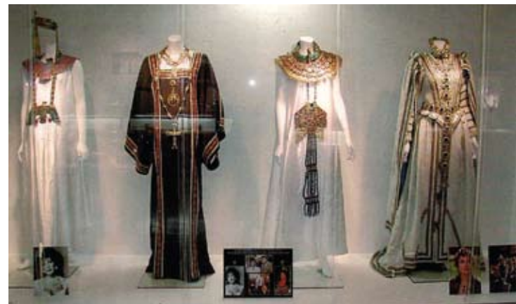
Mostra de jóias cenográficas assinadas por Sacco.

A exposição na Casa do Trem, viabilizada pelo Instituto Italiano di Cultura, representa o evento de maior importância na programação comemorativa aos 150 anos da unidade da Itália, no âmbito do Projeto “Momento Itália e Brasil - 2011-2012”