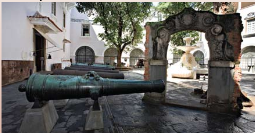
Pátio dos Canhões