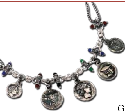
Colar em prata da linha “Cinco Províncias”, inspirado na história da Calábria.

De 7 de julho a 11 de setembro, o térreo da Casa do Trem estará abrigando a exposição “Contos Preciosos de Gerardo Sacco, da Magna Grécia ao Terceiro Milênio”.