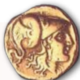
Coleção do MHN: Patrimônio da Humanidade