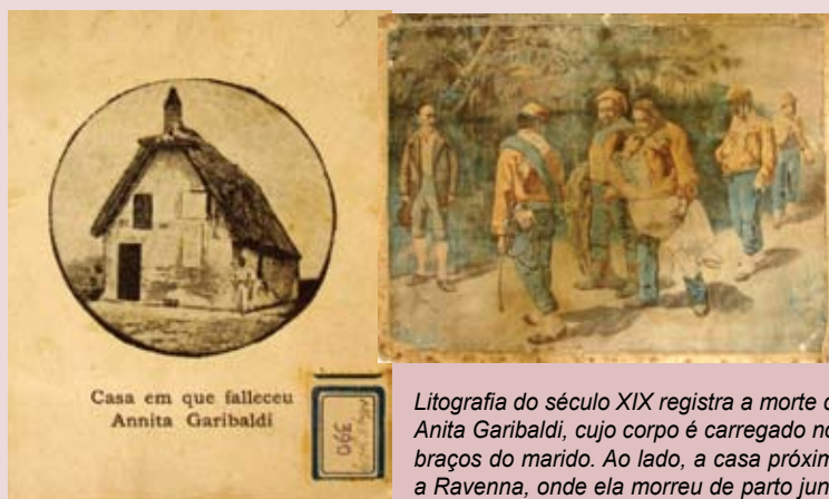
Litografia do século XIX registra a morte de Anita Garibaldi, cujo corpo é carregado nos braços do marido. Ao lado, a casa próxima a Ravenna, onde ela morreu de parto junto com o seu quinto filho.