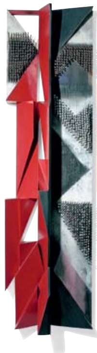
Exposição “Emanoel Araujo - Autobiografia do Gesto/Cosmogonia dos Símbolos”

Cosmogonia dos Símbolos, Navio II/ Madeira pintada, pregos/ 2007